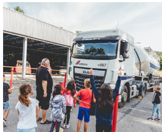
Děti si také vyzkoušely, jaký má řidič kamionu výhled před sebe