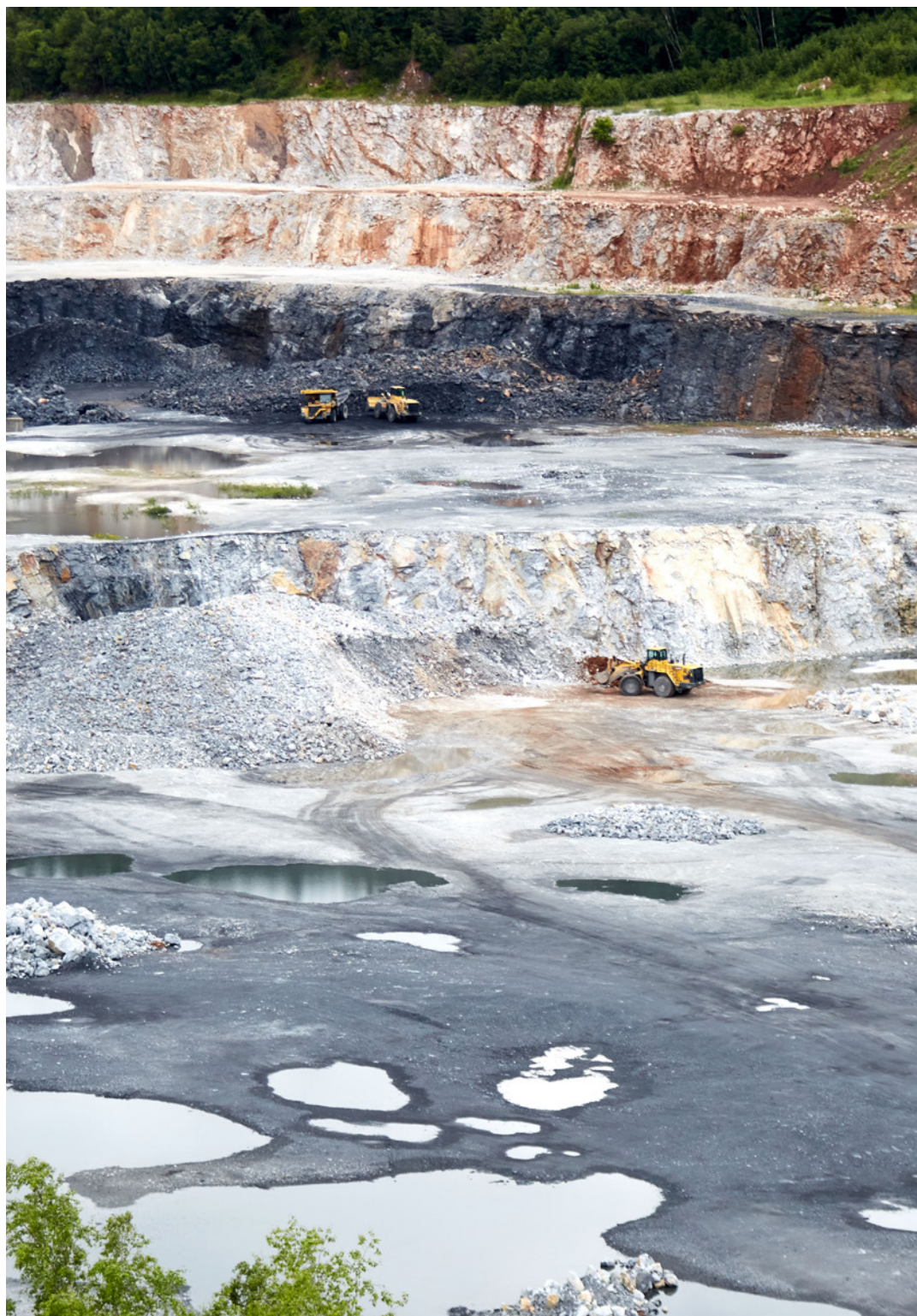
Vápenec pro výrobu cementu se těží přímo v Prachovicích

V Prachovicích těžíme základní surovinu pro výrobu cementu, vápenec. Díky tomu nemusíme materiál odnikud přivážet.