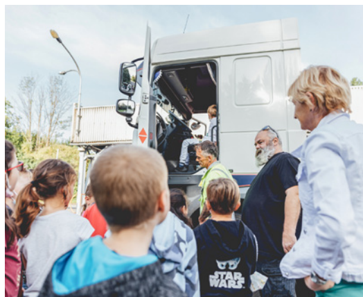
Nejvíce si děti užily sezení na místě řidiče nákladního vozidla

CEMEX si navíc na závěr pro děti přichystal překvapení – reflexní batůžek plný praktických dárek pro větší bezpečnost v silniční dopravě. Žáci z prachovické základní školy tak budou na ulicích zase o kousek více v bezpečí.