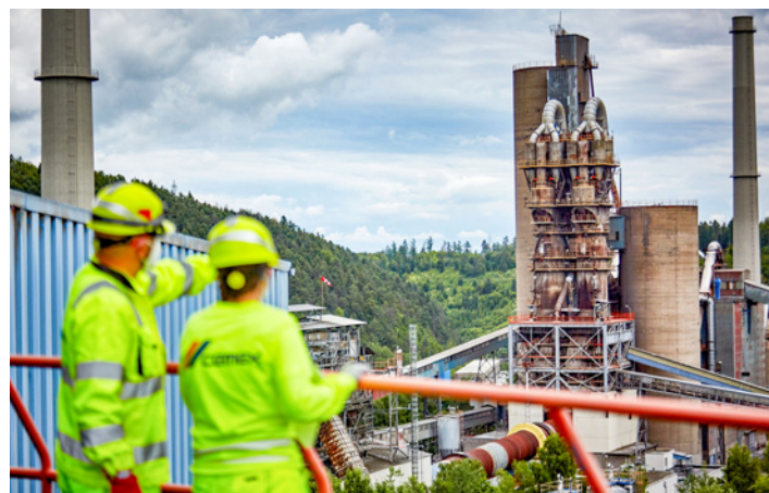
Pohled na největší rotační pec v ČR