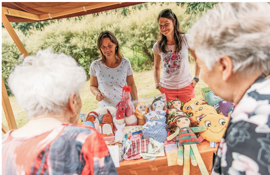
Kromě vynikajících regionálních potravin byla na trzích i celá řada dalšího zboží od místních řemeslníků

Řada návštěvníků si kromě toho nechal ujít ani kávu od společnosti World Coffe Roaster. Ta má sice doslova světový název, ale ve skutečnosti jde o malou pražírnu, kterou vede pár sympatáků v Medle-