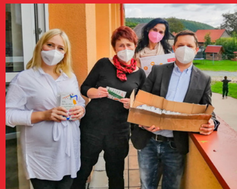
V září dostal každý žák jedno pravítko