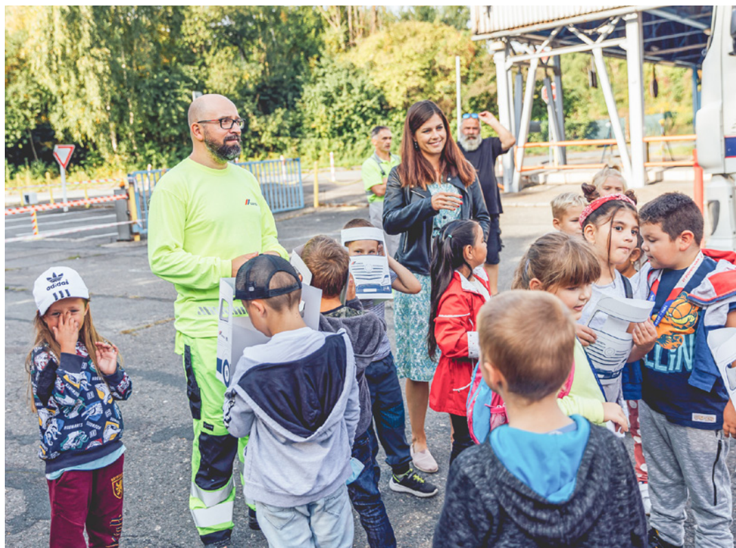
Díky speciálním brýlím si žáci vyzkoušeli chození se zmenšeným zorným úhlem