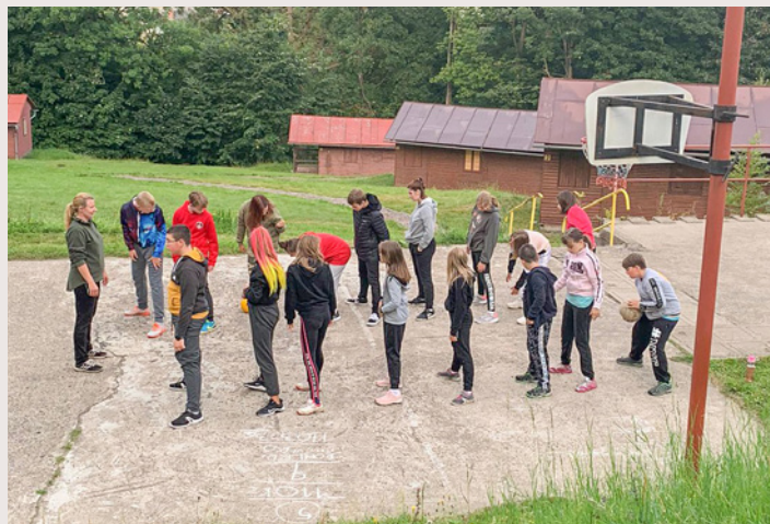
Kromě ubytování žáci využili i místní hřiště a krásnou přírodu v okolí