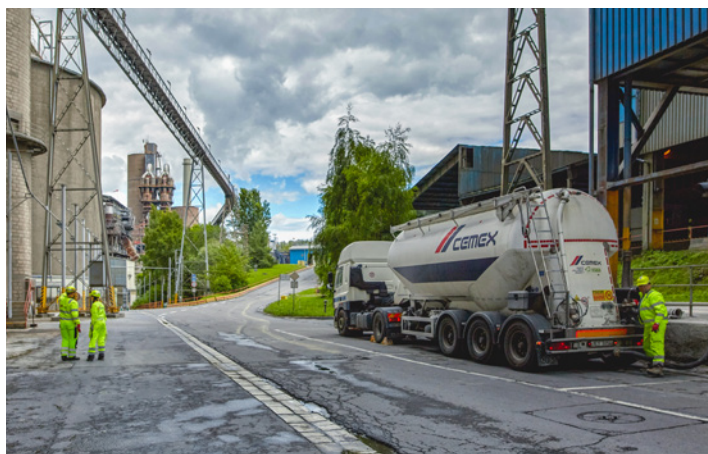
Přpravu materiálů po provozu zajišťují pásy i nákladní vozy

To důležité se odehrává v rotační peci, kde vzniká hlavní součást cementu: slínek.